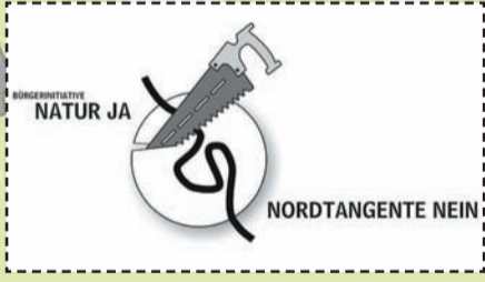
Bürgerinitiative "Natur ja - Nordtangente Nein" Passau, Juli 2009, Bearbeitung: S.M.